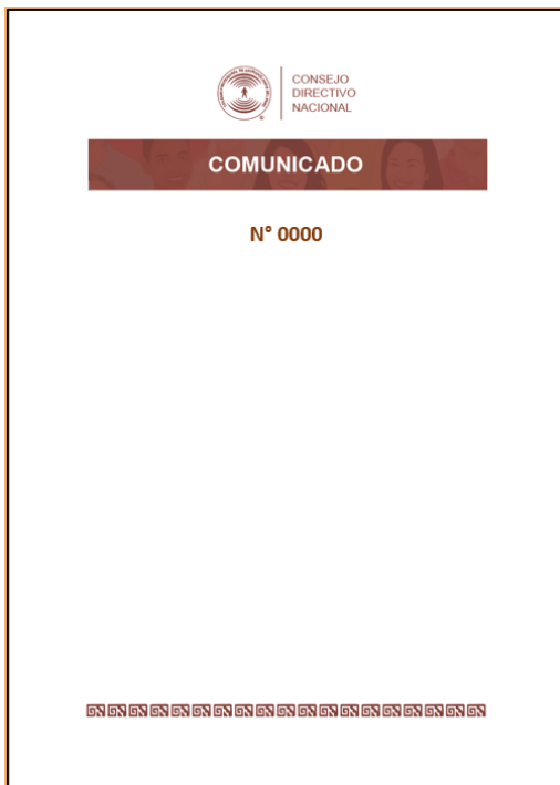
Modelo hoja membretada 2